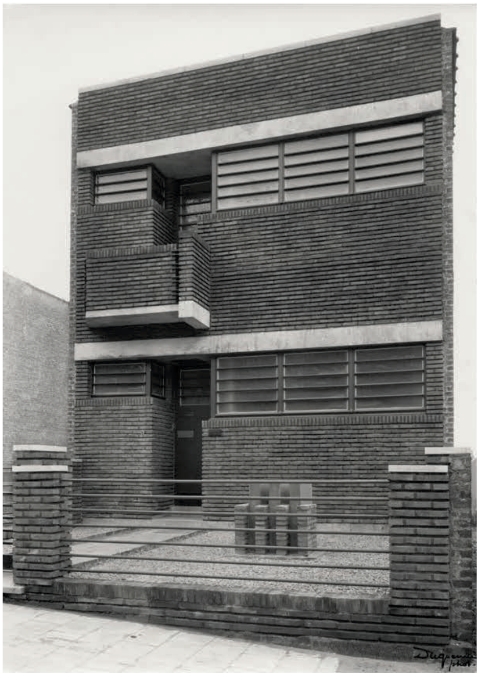
Woning Sweerts, Messidorlaan 9, Ukkel, 1929–31. Verbouwd