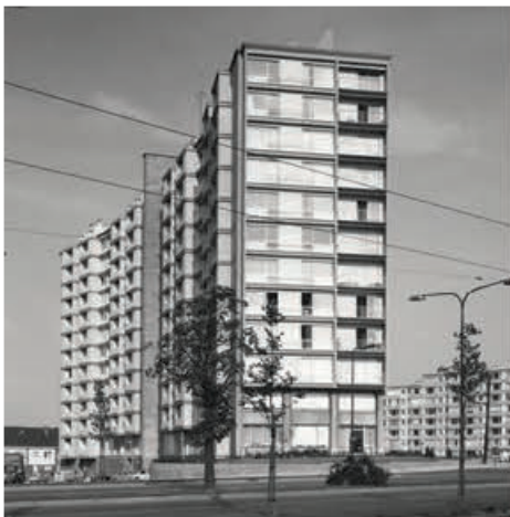
Zijgevel aan de Wahislaan. Historische foto

twee lokalen voor kantoren, studio's en aan beide uiteinden appartementen. Ze is zo ontworpen als een soort actieve binnenstraat die animo geeft aan het leven in het gebouw. Het complex is ook bereikbaar via de Bloemtuinenlaan waar bijkomende toegangen zijn aangebracht in het verlengde van de distributiekernen.