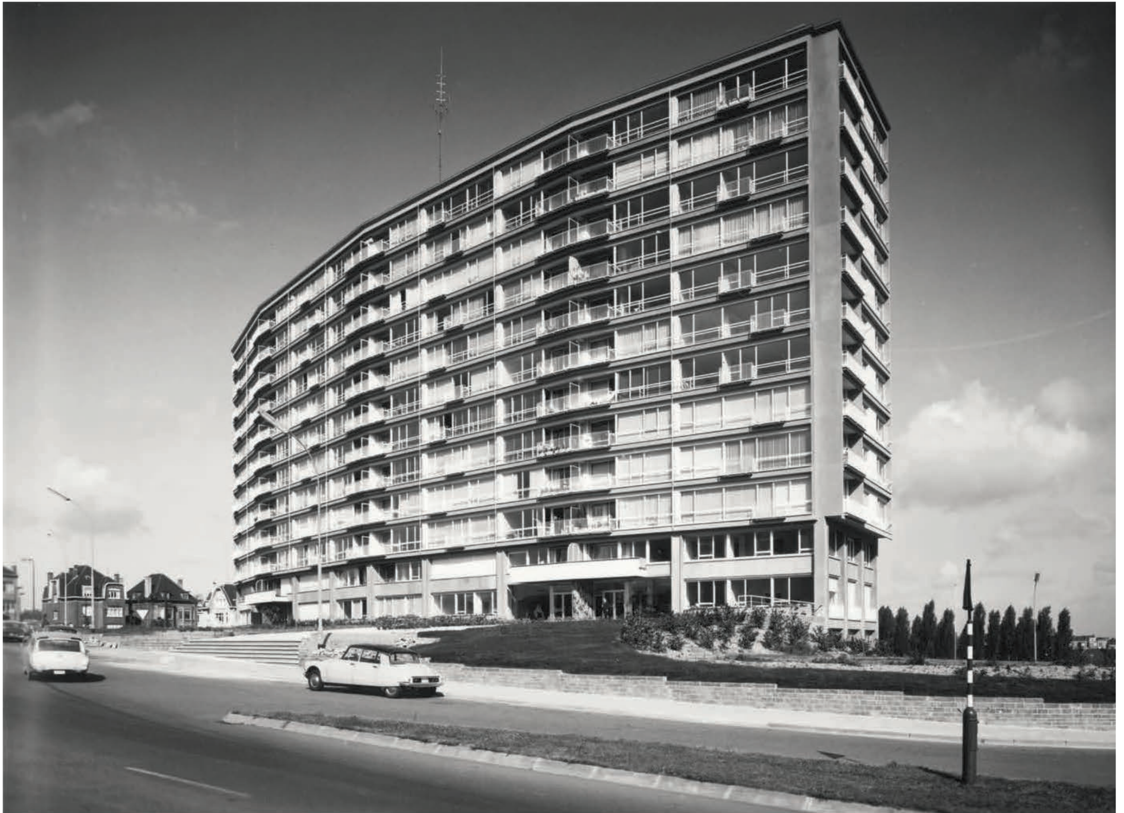
Gewel aan de Leopold III-laan. Historische foto