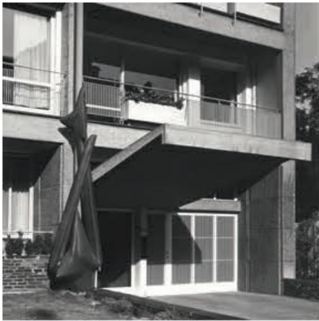
Ingang met sculptuur van Frans Lamberechts. Historische foto

ander publiek aan te trekken. De bovenste inspringende verdieping heeft een monumentale uitkragende pergola.