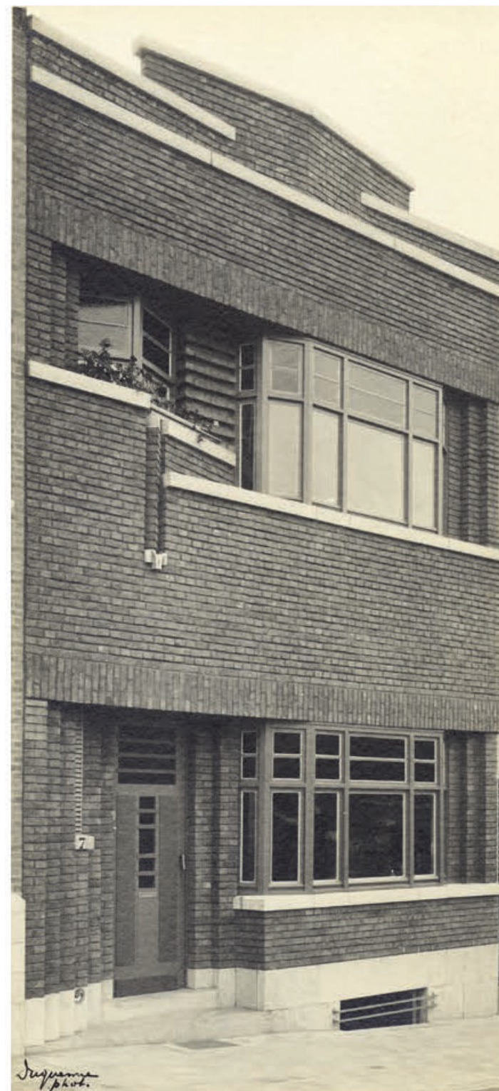
Straatgevel. Historische foto